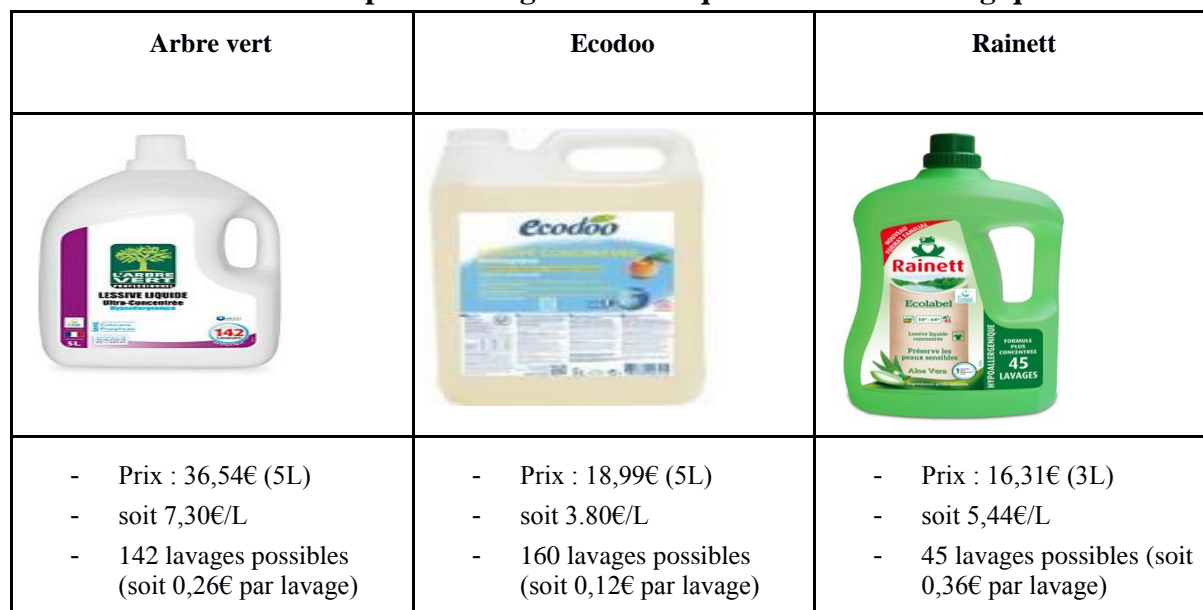
Tableau comparatif des grandes marques de lessives écologiques

En résumé, Ecodoo semble être un concurrent sérieux compte tenu du rapport qualité prix. Pour conclure, face à la concurrence et notre faible notoriété, il faut que notre lessive soit vendue à un prix inférieur à 3,80€ par litre (soit moins de 7,60€ pour un bidon de 2 litres).